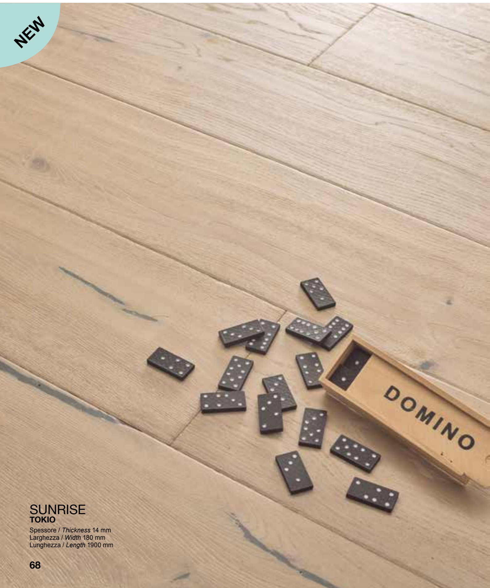
SUNRISE TOKIO Spessore / Thickness 14 mm Larghezza / Width 180 mm Lunghezza / Length 1900 mm